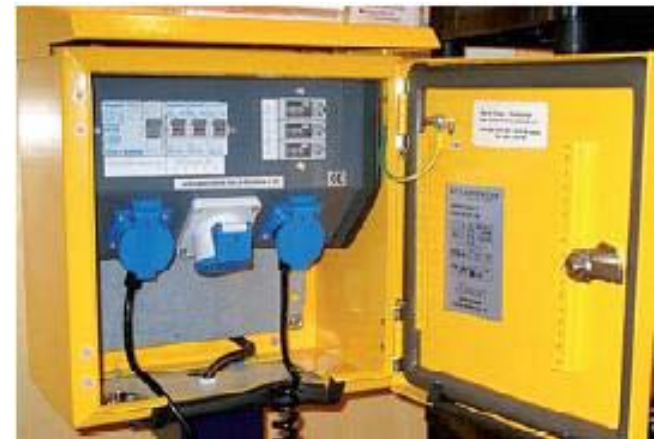
Park & Charge-Ladestation